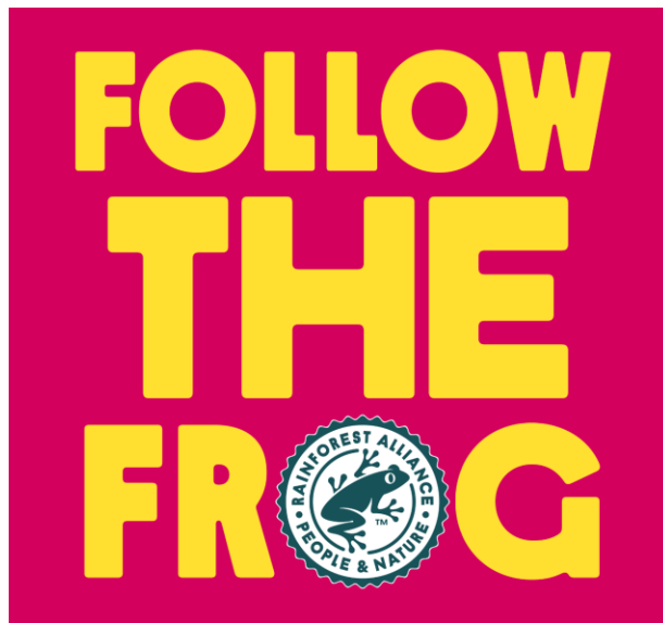
20 segundos de animación (MP4)