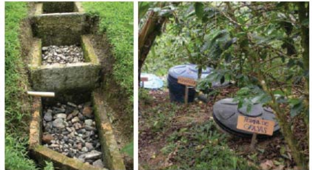
2つの水処理システムの例。左側は地元で調達できる材料で作られており、右はより高価なファイバーガラスのタンク

結果は、認証のコストと利益が、幅広いことを示しています。また、基準に従いながらも、より安価な技術的な解決策の奨励により、認証コストを下げる機会がある事もわかりました。