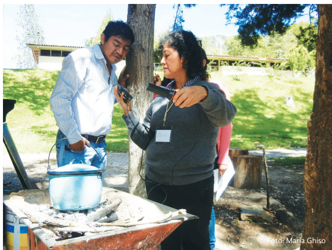
Después de repasar el ciclo del carbono, maestros de comunidades del estado de Oaxaca hacen actividades prácticas de medición para confirmar que leña quemada en una cocina emite dióxido de carbono a la atmósfera.

que afectan directamente a sus comunidades y promueven que los estudiantes desarrollen, implementen y administren proyectos de acción comunitaria que benefician a sus escuelas y comunidades 5 . Esto ha permitido a los maestros promover el desarrollo de proyectos sobre cambio climático y bosques liderados por los estudiantes.