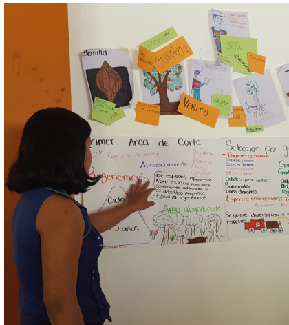
Jóvenes analizan el proceso de manejo forestal sostenible y los empleos y oportunidades disponibles en cada parte de la cadena de valor forestal.

Después de participar en las actividades antes mencionadas, los jóvenes participantes están listos para adquirir experiencia práctica y probar sus intereses. Como parte de este trabajo, estamos colaborando con un despacho local de servicios técnicos forestales que trabajara para conectar a los jóvenes con pasantías y aprendizajes. Esto proporcionará a los estudiantes una oportunidad concreta y dará a los líderes de la comunidad la oportunidad de entender las habilidades y la energía que estos jóvenes traen a la mesa. Nuestra esperanza es que los estudiantes sean capaces de visualizar el impacto