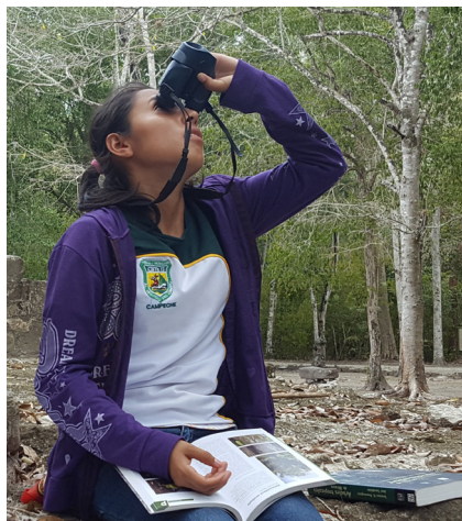
Durante una visita de campo a la Reserva Biológica de Calakmul, una estudiante identifica especies locales de vegetación.

Además de mejorar la administración futura de los recursos naturales, la desaceleración de la emigración juvenil ofrece beneficios económicos potenciales a las comunidades. Aquellos que emigran tienden a ser motivados, educados e innovadores—precisamente aquellos que pueden fomentar el desarrollo si se quedan. El compromiso cívico es bueno para los jóvenes también: ha sido identificado por el Banco Mundial como extremadamente importante para ayudar a una transición saludable a la edad adulta, así como un contribuyente importante al cambio social positivo. 13 Inculcar un sentido de responsabilidad y deber cívico en la juventud crea ciudadanos adultos más productivos y activos. El compromiso cívico se presta a crear oportunidades para promulgar cambios. 14