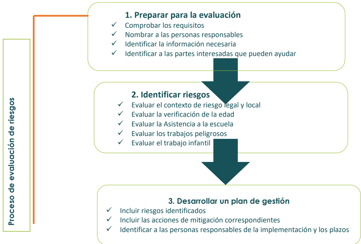
Figura 2. Diagrama de flujo del proceso de evaluación de riesgos

Este diagrama de flujo establece las etapas clave de la realización de una evaluación de riesgos: prepararse y prepararse, realizar la evaluación para identificar los riesgos y coordinar los resultados en el plan de gestión para que pueda tomar medidas para mitigar o remediar.