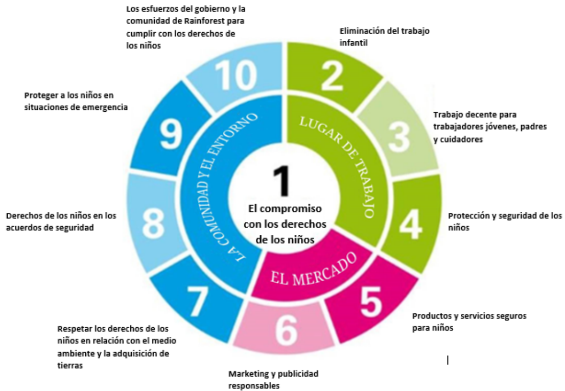
Figura 3. Reseña de los CRBPs, UNICEF 6