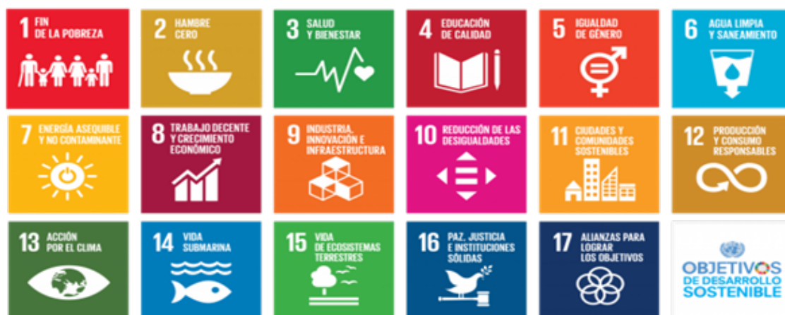
Figura 4. Los Objetivos de Desarrollo Sostenible (ODS) 7

Los ODS se relacionan estrechamente con los derechos de los niños y la cuestión del trabajo infantil. Por ejemplo, los ODS establecen el objetivo de que para 2030 todos los niños y niñas completen una educación primaria y secundaria gratuita, equitativa y de calidad que conduzca a resultados de aprendizaje pertinentes y eficaces. También establecen el objetivo de tomar medidas inmediatas y eficaces para erradicar el trabajo forzoso, poner fin a la esclavitud moderna y la trata de personas y asegurar la prohibición y eliminación de las peores formas de trabajo infantil, incluido el reclutamiento y el uso de niños soldados, y para 2025 poner fin al trabajo infantil en todas sus formas. Más información sobre los ODS y cómo se vinculan a los niños se puede encontrar a continuación.