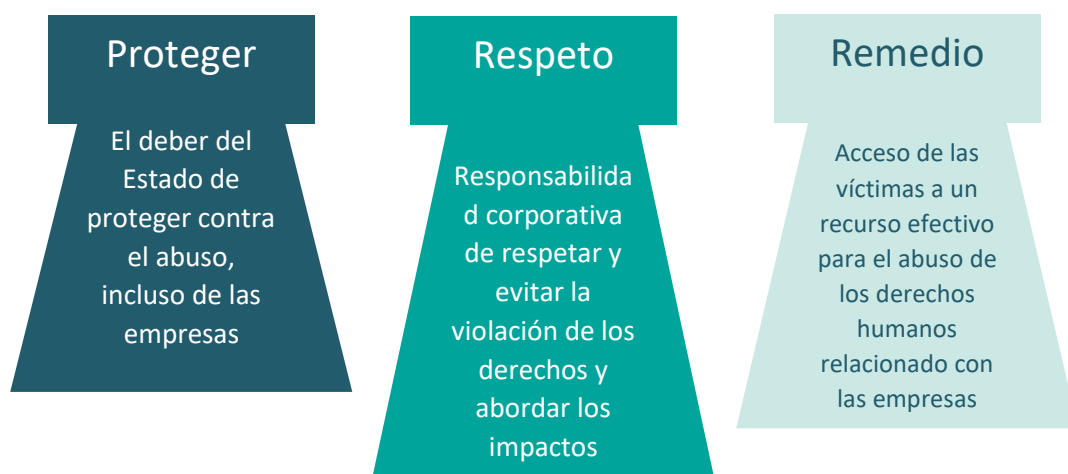
Figura 2. Los 3 pilares de los PNUD

Los PNUD fueron adoptados por unanimidad en 2011 por el Consejo de Derechos Humanos de las Naciones Unidas y son el marco más reconocido para esbozar las responsabilidades de los gobiernos y las empresas con respecto a los derechos humanos. Los PNUD se basan en tres pilares; el deber del Estado de proteger contra el abuso, incluso de las empresas, la responsabilidad corporativa de respetar y evitar la violación de los derechos y abordar los impactos y el acceso de las víctimas a un recurso efectivo para el abuso de los derechos humanos relacionado con las empresas: 5