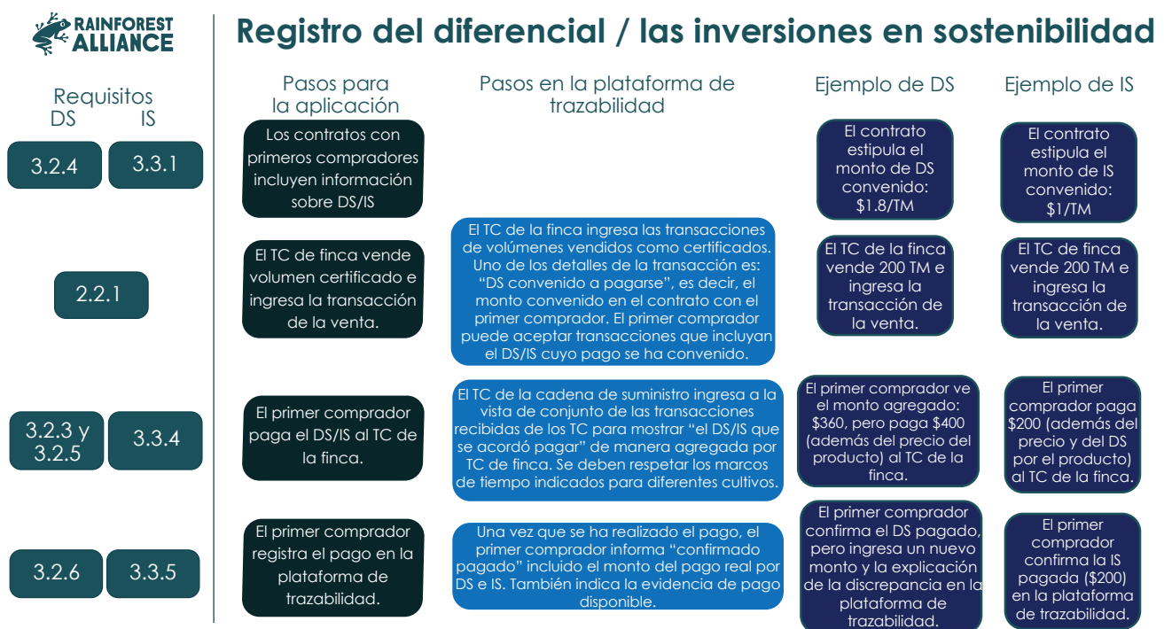
Diagrama 2: registro del DS y de las IS