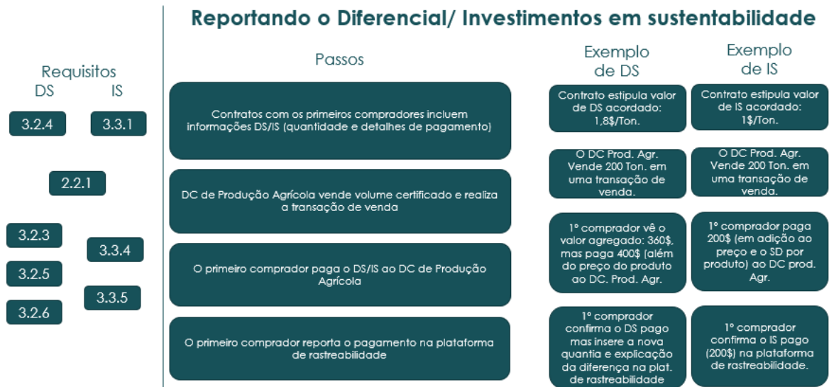
Diagrama 2: reportando os pagamentos de IS e DS no Marketplace 2.0.