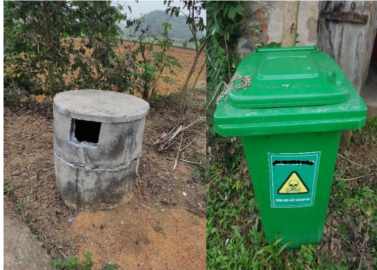
Hình 2: ví dụ về thùng chứa bao bì thuốc BVTV