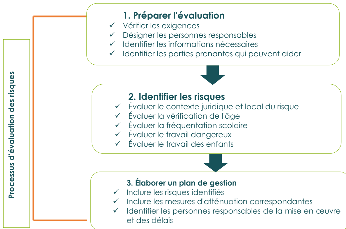
Figure 2. Organigramme du processus d'évaluation des risques