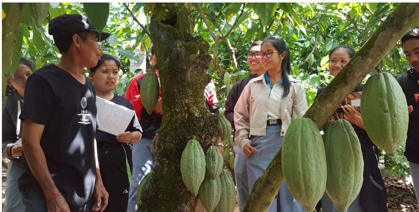
Jóvenes visitan una finca de cacao en Jembrana, Indonesia.

se debe en parte la inadecuación de habilidades entre los sistemas educativos y formativos y las demandas del mercado laboral moderno.